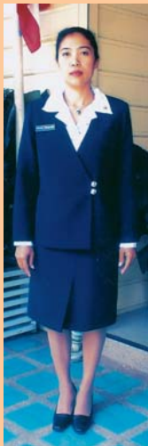
เครื่องแบบสมาคมฯ ชุดใหญ่

ตั้งแต่ที่ได้ก่อตั้งสมาคมนักวิทยาทานเรือเมื่อปี พ.ศ.๒๕๑๔ เป็นต้นมา ได้มีการกำหนดรูปแบบของกรรมการบริหารสมาคมฯ เพื่อให้การแต่งกายมีความเป็นระเบียบและสวยงามสำหรับไปร่วมพิธีหรือกิจกรรมต่างๆ โดยที่ผ่านมามีการปรับเปลี่ยนเครื่องแบบบางส่วนให้มีความเหมาะสม ซึ่งปัจจุบันมีการใช้เครื่องแบบสมาคมฯ ๔ ชุด ดังนี้