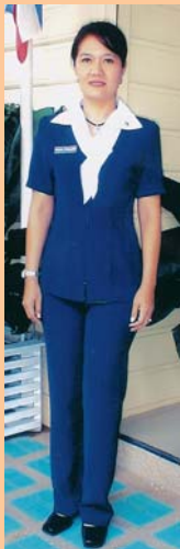
เครื่องแบบสมาคมฯ ชุดเล็ก (กางเกง)