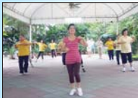
เดินแอโรบิก

เวลา ๑๕.๐๐ น. - ๑๖.๐๐ น. ไม่อยากบอกเลยว่าหลายคนแอบท้อบอีก..อีก..แต่ก็บึ่งเต็งตั้งขึ้นนะ ไม่อยากจะไม่ แล้วพวกเราจะเป็นพวกแก่ยาก ดายยากอย่างแน่นอน ช้าว้าซากว ทร. ที่สนใจจะร่วมเดินกับเราก็กเชิญเลยนะคะ ไม่มีค่าใช้จ่าย แล้วก็มาได้ทุกครั้ง ป้า ๆ เป็นคนยุคใหม่ ไม่น่ากลัวหรอกคะ