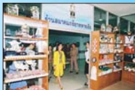
ร้านสมาคมภริยาทหารเรือ สาขา โรงพยาบาลศิริราช