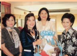
พลตรีหญิง คุณหญิง วรรณีย์ ปัจจุสานนท์