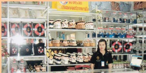
สาขากันทุปรณ์ หน่วยบัญชาการนาวีกโยธิน