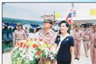
ร้านสมาคมภริยาทหารเรือ สาขาที่สมุทร จังหวัคพังงา