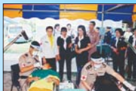
โครงการเฉลิมพระเกียรติ