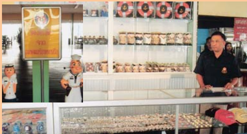
สาขาเรือนสักประดู่ หน่วยบัญชาการนาวิกโยธิน