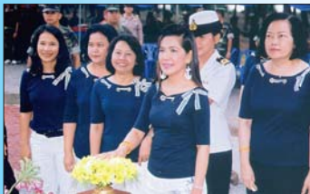
พิธีมอบสรวายน้ำ ๒๒ ก.ย.๕๐