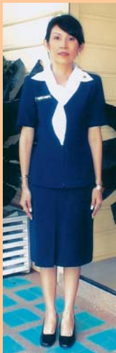
เครื่องแบบสมาคมฯ ชุดเล็ก (กระโปรง)