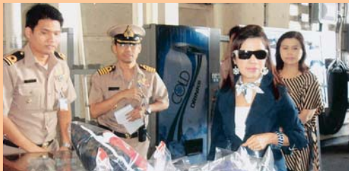
สาขาเรือหลวงจักรีนฤเบศร