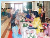
รดน้ำขอพร

นอกจากโครงการต่าง ๆ แล้ว เรายังได้ริเริ่มและปรับปรุงงานหลายอย่าง เช่น การจัดงานรดน้ำขอพรจากอดีตนายกสมาคมกรรียาทหารเรือเนื่องในวันสงกรานต์