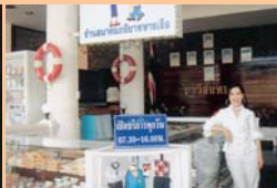
สาขาอาคารรับรอง ๒ ฐานทัพเรือสัตหีบ