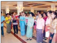
รศ.นงนุชพร

ทำคุณประโยชน์ไว้ให้สังคมฯ อย่างมากมาย บรรรยากาศของงานเราก็จัดเป็นแบบไทย ๆ คล้ายกับงานวัดในสมัยก่อน ทุกคนที่มาร่วมงานก็ซบซึ้งพร้อมกับสนุกสนานไปในตัวด้วย นอกจากนี้เรายังจัดงานระลึกถึงพระคุณแม่