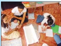
แม่อาสาออกเยี่ยมตามบ้าน