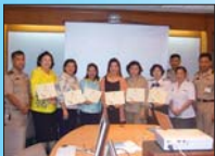
อบรมคอมพิวเตอร์

โดยกรมสวัสดิการทหารเรือจัดเจ้าหน้าที่และอุปกรณ์มาช่วยสอนให้ ตอนนี้อยู่รวมไป ๒ รุ่นแล้ว ป้าทั้งหลายได้เรียนรู้ขั้นเบะ สามารถแชต แชด กับหลาน ๆ ได้แล้ว แล่นายกสมาคม ฯ ยังเดิรุ่นใหญ่ เปิดเว็บไซต์สมาคม ฯ อัฟเฟคหรือมูลนิธิ บางครั้งก็ตอบคำถามด้วยตัวเองนะจะบอกให้ ก็ขอเชิญแวะเข้าไปชมได้ที่ www.navy.mil.th/nwa