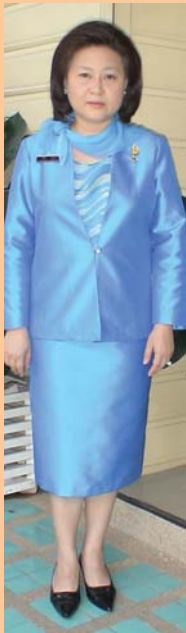
เครื่องแบบธรรมาจารย์ ชุดใหญ่ (ภคิยาวาศสิน)