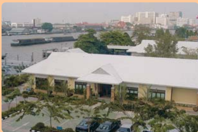
อาคารสมาคมภริยาทหารเรือ