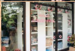
สาขาสรรพกริยานาวีกโยธิน