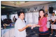
งานระลึกถึงพระคุณแม่

เนื่องในวันแม่แห่งชาติ เพื่อพบปะพูดคุยและปลอบใจแม่ผู้เสียสละฝ่ายทหารเรือ ซึ่งได้รับคัดเลือกให้เป็นแม่ดีเด่น เนื่องจากบุตรชายของท่านได้เสียสละชีวิตเพื่อปกป้องอธิปไตยของชาติ โดยดิฉันได้มอบเงินบำรุงขวัญเพิ่มให้ท่านละหนึ่งหมื่นบาท และยังส่งจดหมายเพื่อแสดงความระลึกถึงในเดือนสิงหาคมของปีต่อไปด้วย ซึ่งจะทำให้เขารู้สึกว่าไม่ถูกทอดทิ้ง บรรรยากาศในงานก็น้ำตาไหลไปตาม ๆ กัน