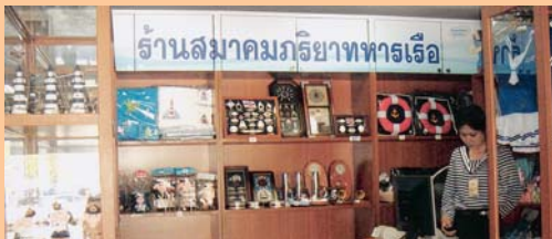
สาขากันทุพกรณ์ กองเรือยุทธการ