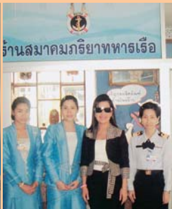
สาขาโรงพยาบาลสมเด็จพระนางเจ้าสิริกิติ์