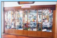
ร้านสมาคมภริยาทหารเรือ สาขา โรงพยาบาลสมเด็จพระปิ่นเกล้า

อากาศยานและรักษาฝั่ง ที่ติดันมักจะเรียกว่าหน่วย ค่าทะเล และอีกมากมายที่คงเอ่ยในที่นี้ไม่หมด