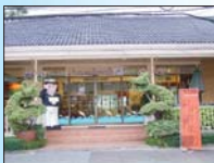
เลี้ยงอาหารประชาชนทั่วไป