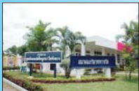
อาคารศูนย์แม่ สัตหีบ