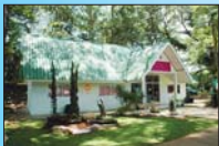
อาคารศูนย์แม่ จันทบุรี