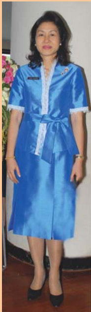
เครื่องแบบธรรมาจารย์ ชุดเล็ก (ภคิยาวาศสิน)